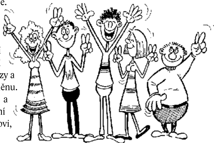
Žáci 6. C